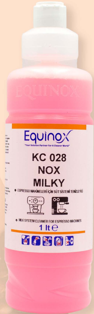
KC 028 NOX MILKY

Plastik borular ve buhar çubuklarında; arta kalan süt ve protein artıkları, bakteriler ve tıkanmalar giderilir. Makinenizin ömrü uzar.