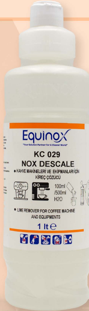
KC 029 NOX DESCALE

Plastik borular, buhar çubukları ve rezistanslarda oluşan ve enerji kaybına neden olan kireç kalıntıları giderilir. Makinenizin ömrü uzar.