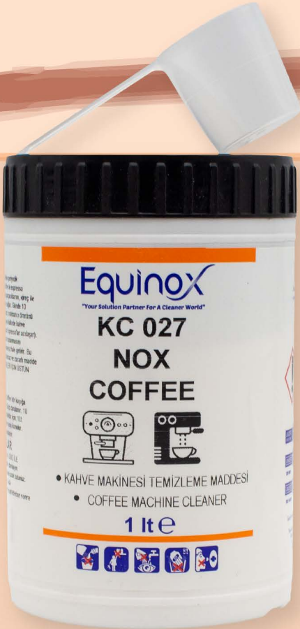
KC 029 NOX COFFEE

Kahve makinesinde oluşan kahve yağlarını, kahve parçacıklarını (telve). Kireç ve kötü kokuları giderir. Makinenin daha uzun ömürlü olmasını sağlar.